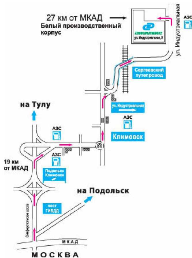
СХЕМА ПРОЕЗДА ОТ МОСКВЫ

Завод изготовитель. Сервисный центр Зал оптово-розничной торговли